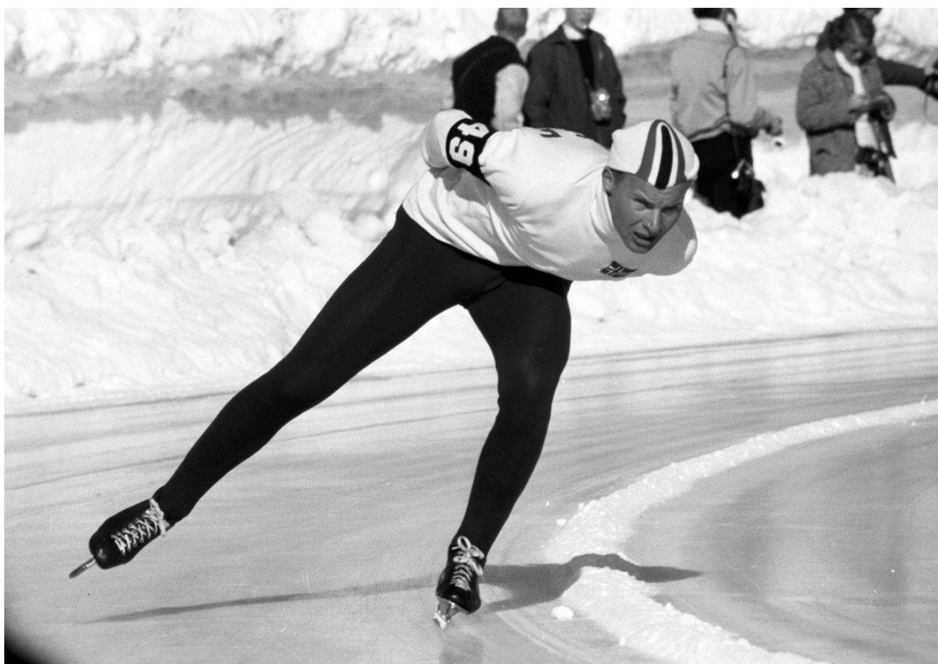
Kupper'n i fint driv under 10.000 m under OL i Squaw Vally, der han vant på tiden 15.46.6.